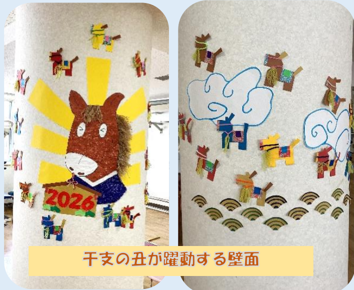
干支の丑が躍動する壁面