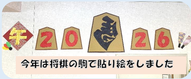
今年は将棋の駒で貼り絵をしました