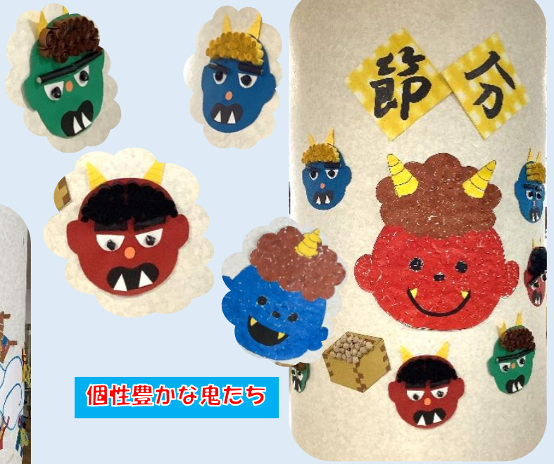
個性豊かな鬼たち